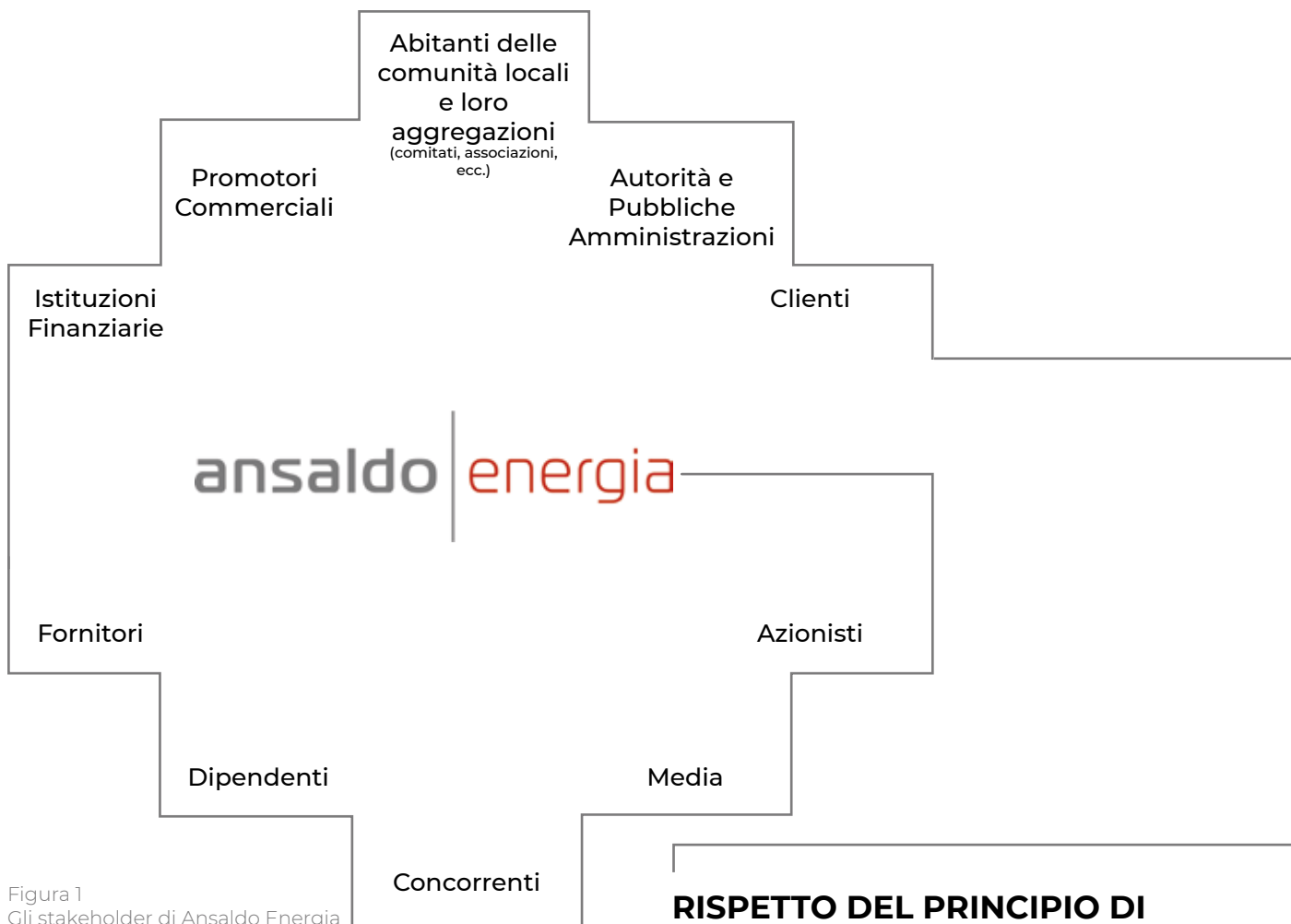
Figura 1 Gli stakeholder di Ansaldo Energia